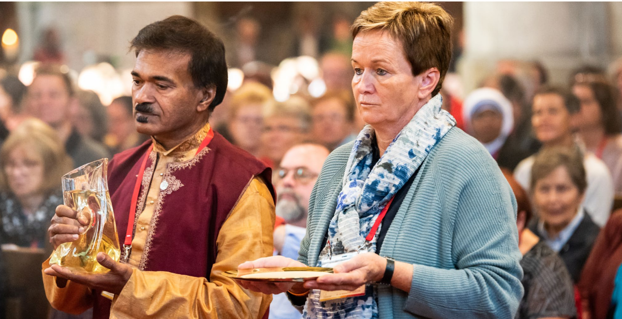
Gabenprozession durch Mittelgang

„Wenn du also den Leib Christi verstehen willst, höre den Apostel, der den Gläubigen sagt: »Ihr aber seid der Leib Christi und seine Glieder« (1 Kor 12,27). Wenn ihr also Leib und Glieder Christi seid, dann liegt euer Geheimnis auf dem Tisch des Herrn: Euer Geheimnis empfangt ihr. Zu dem, was ihr seid, antwortet ihr Amen. Diese Antwort ist eure Unterschrift. Du hörst: Leib Christi, und antwortest: Amen. Sei ein Glied am Leib Christi, damit dein Amen wahr sei!“ (Augustinus, Predigt 272)