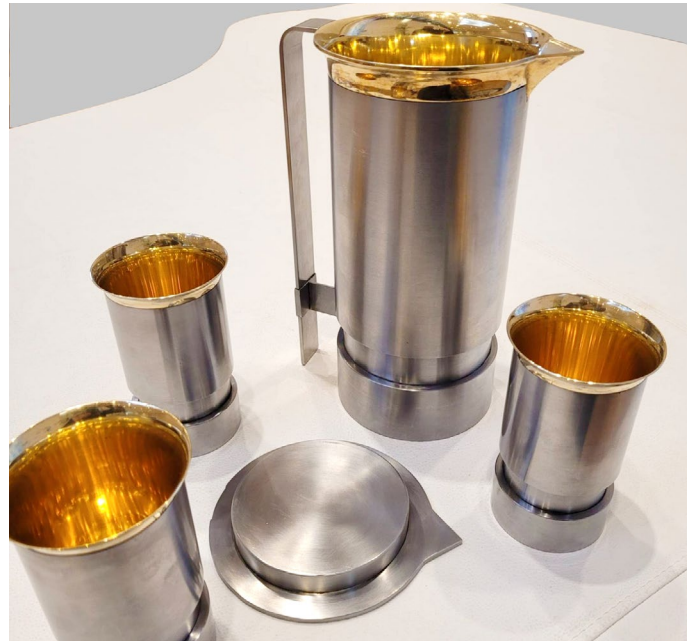
Kelch mit Schüttrand (links)